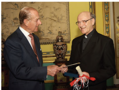
Uroczystość wręczenia nagrody przez księcia Filipa