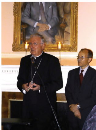
Przemawia kard. Cormac Murphy-O'Connor, abp Westminsteru