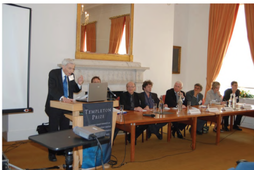
Przemawia lord Martin Rees